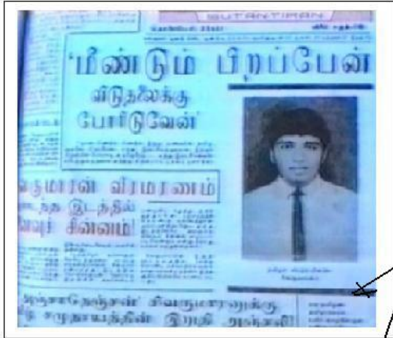
நன்றி / சுதந்திரன்

Tuesday, 15 June 2010 18:47 - Last Updated Wednesday, 16 June 2010 19:16