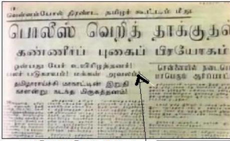
நன்றி-சுதந்திரன் தை 74

Thursday, 20 May 2010 17:26 - Last Updated Wednesday, 16 June 2010 19:14