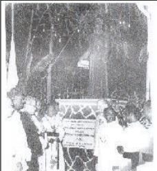
ஊர்வலத்தில் இறந்த இருவரின் உடல்