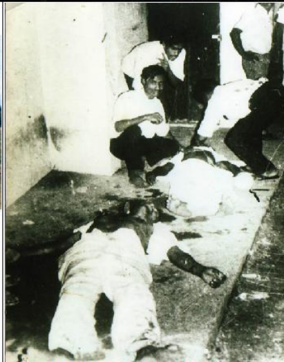
4 வது உலகத் தமிழாராச்சி மாநாடு 03-09 தை 1974