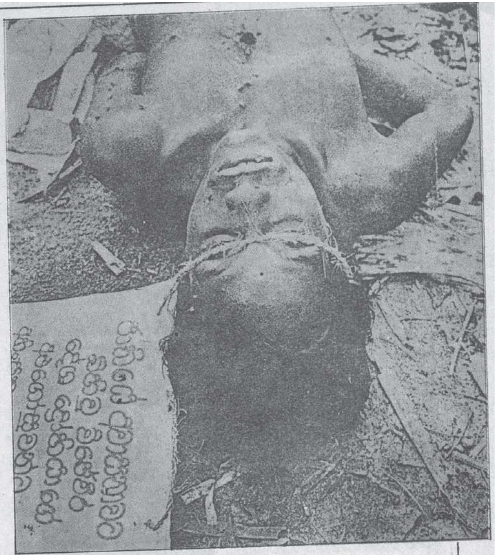
அரசு பயங்கரவாதம்; சிங்கள இளைஞர் பலி

யாழ்ப்பாணக் கோட்டை உட்பட வடக்கிழை சிங்கள இராணுவ முகாம்கள் சிலவற்றைத் தாக்கி அழிப்பதில் புலிகள் வெற்றி பெற்றனர்; ஆனாலும் புலிகளது பாசிசப் போக்கில் மாற்றம் ஏற்படாததால், மக்களிடமிருந்து கணிசமான அளவு ஆதரவை இழந்தனர். தமது சொந்தக் குழு நலன்களை முன்னிறுத்தி மக்கள் தேவைகளை முற்றாகப் புறக்கணிப்பது; கட்டாய வரிவசூல், மாற்றுக் குழுவின் ரெனச் சந்தேகிப்போரை சிறைப்பிடித்துக் கொள்வது; மாற்று இயக்கங்களைத் தடை செய்வதும் அதிகரித்துள்ளது.