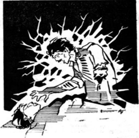
வானே அடுத்த நாள், அக்கா இயக்கத்துக்குப் போய்விட்டாள்.