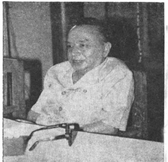
சிறிலங்காவின் நீதி அமைச்சர், ஜனாப் ஏ. சி. எஸ். ஹமீத்

அமைச்சர் ஹமீத் அவர்கள் இப்பிரச்சினையைத் தீர்க்கமாகத் தீர்ப்பதற்கான புதிய அடிப்படை அணுகு முறையை எடுத்துக் கூறி, தமிழீழ விடுதலைப் புலிகளின் ஆதரவையும் ஒத்துழைப்பையும் கோரினார்.